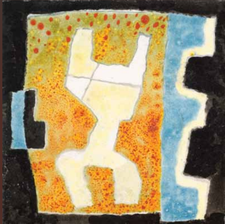
Decorative tiles, 1962-1968