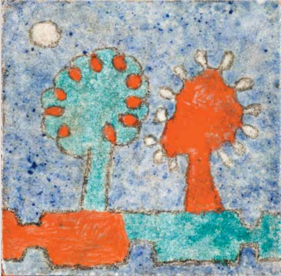
Decorative tiles, 1962-1968