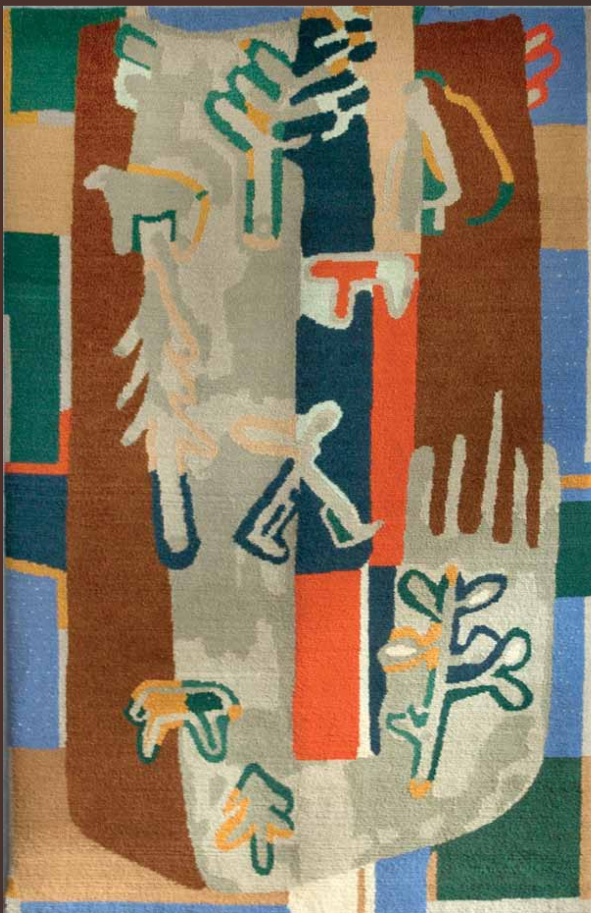
Preparatory designs for carpets, 1937