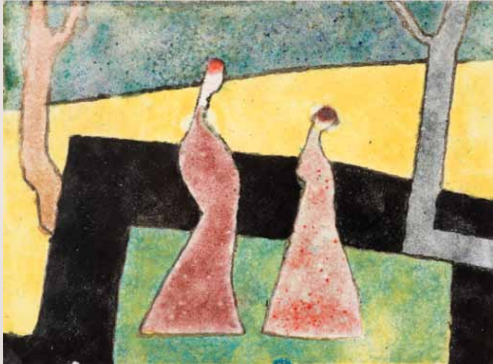
Decorative tiles, 1962-1968