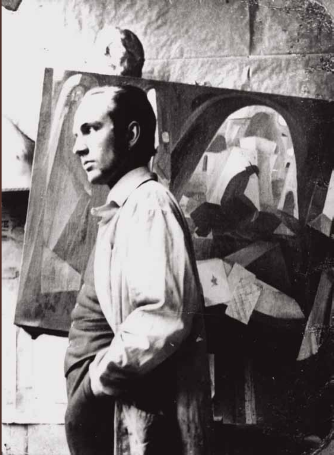
The artist in his atelier in Paris, 1925