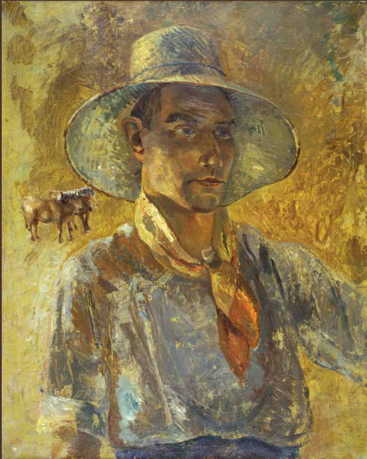
"Shepherd", a self-portrait, 1931