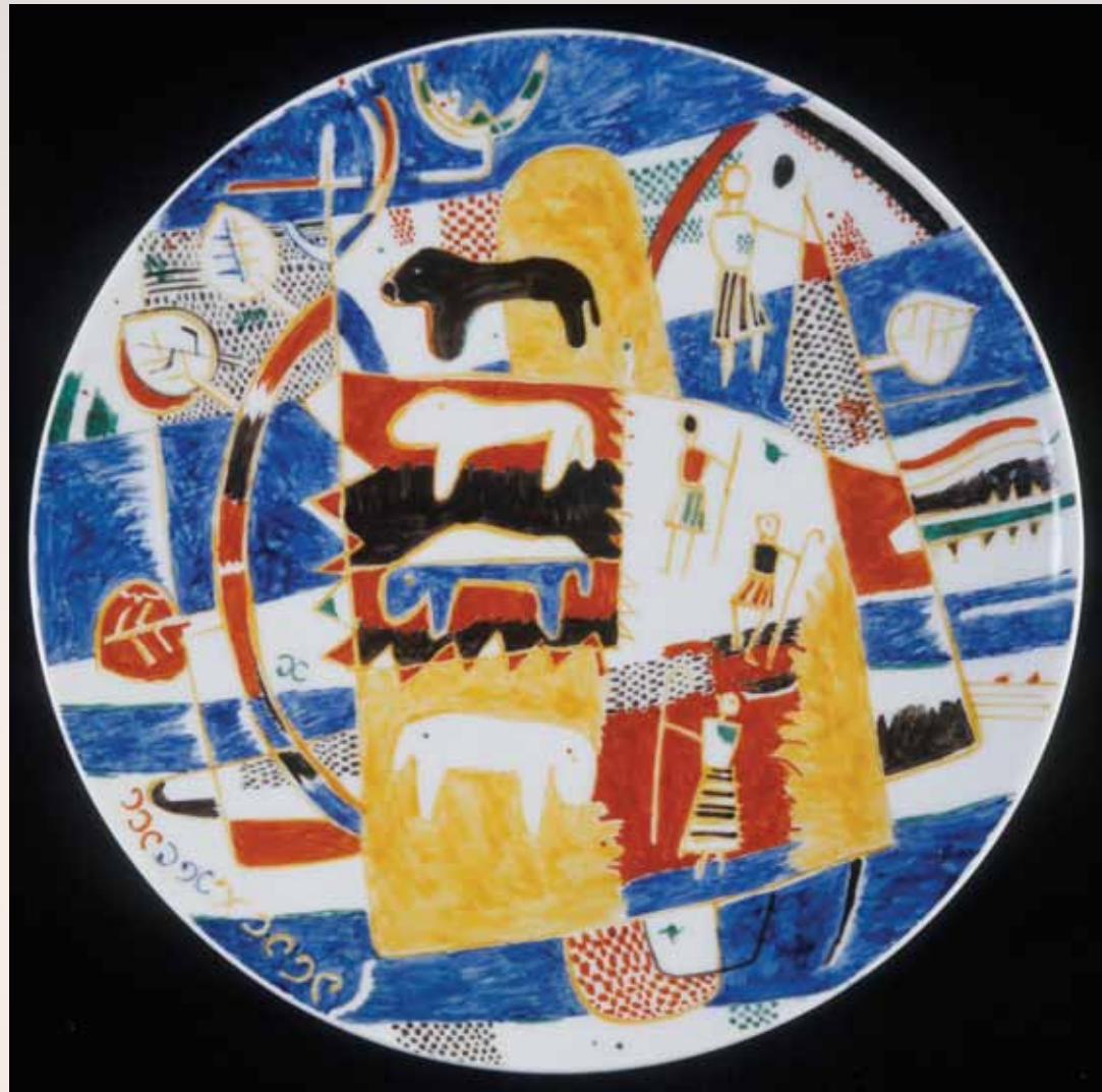
Decorative wall plate, 1937