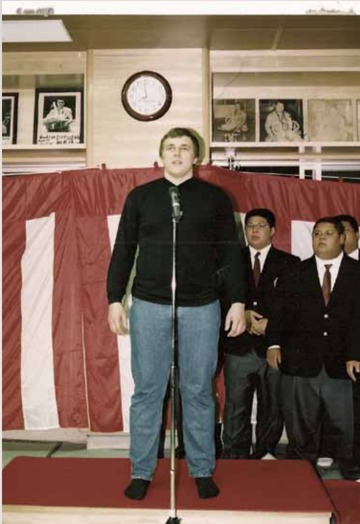
March 2004, before becoming a sumo wrestler.