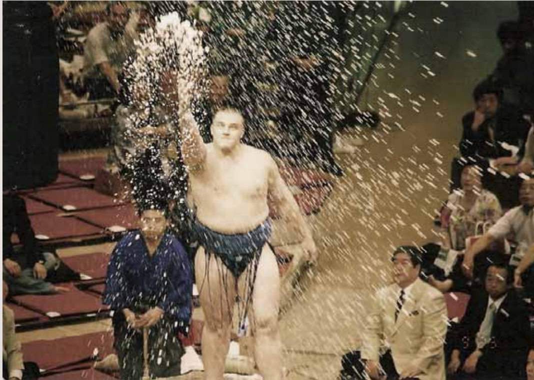
Salt before a match during the Tokyo tournament.