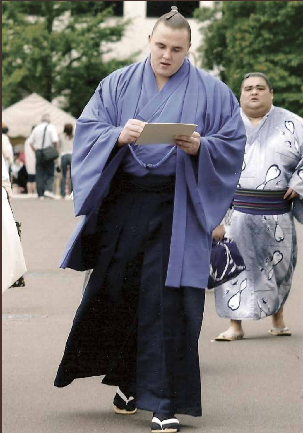
Autographing during the May 2006 tournament.