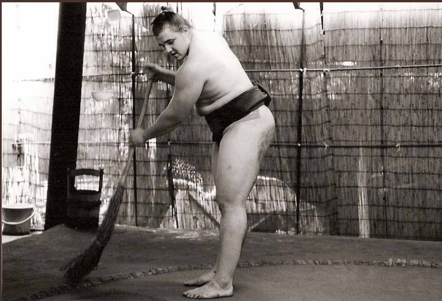
2005, cleaning of the training room before the Nagoya tournament.