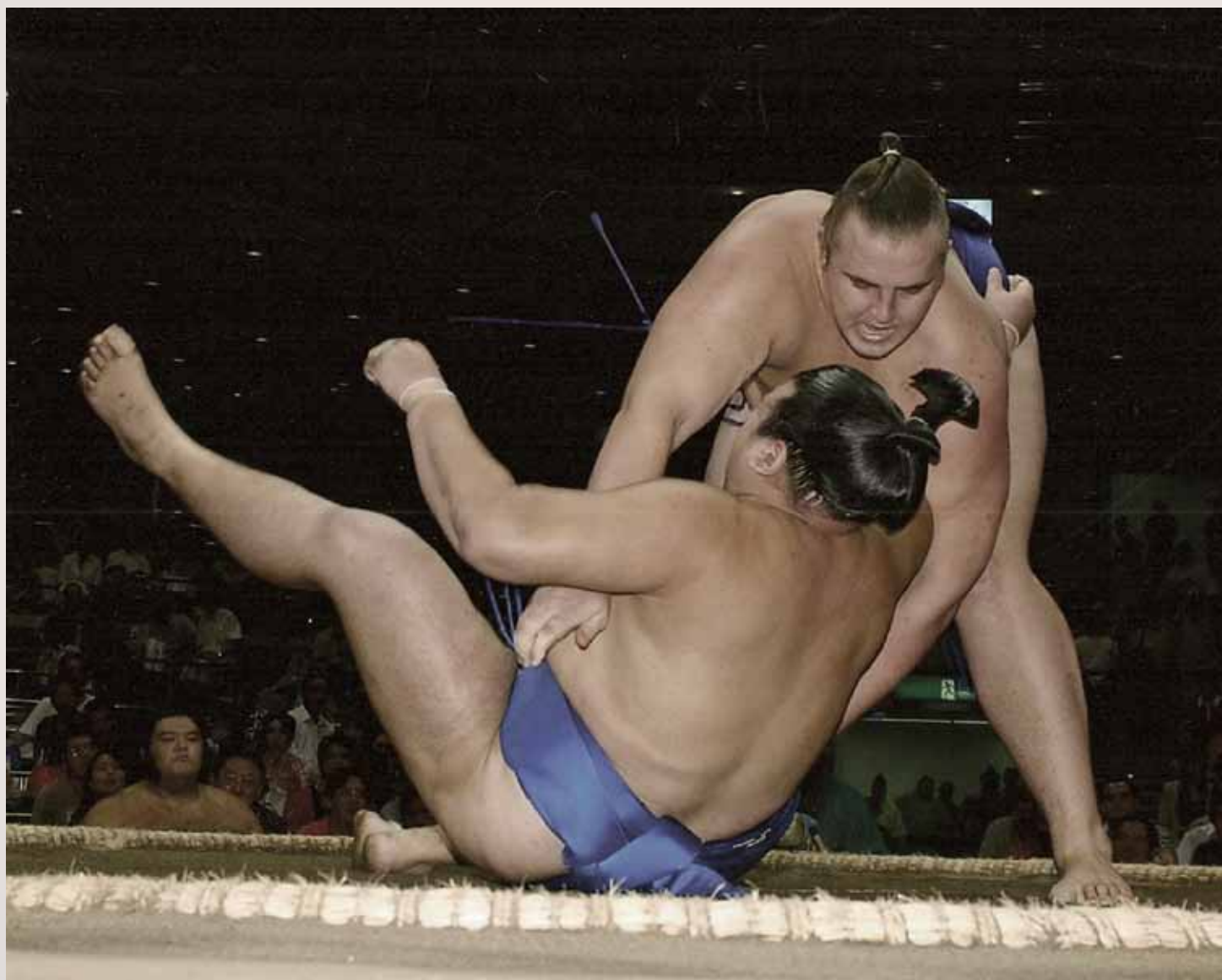
One wrestling match in a higher division.