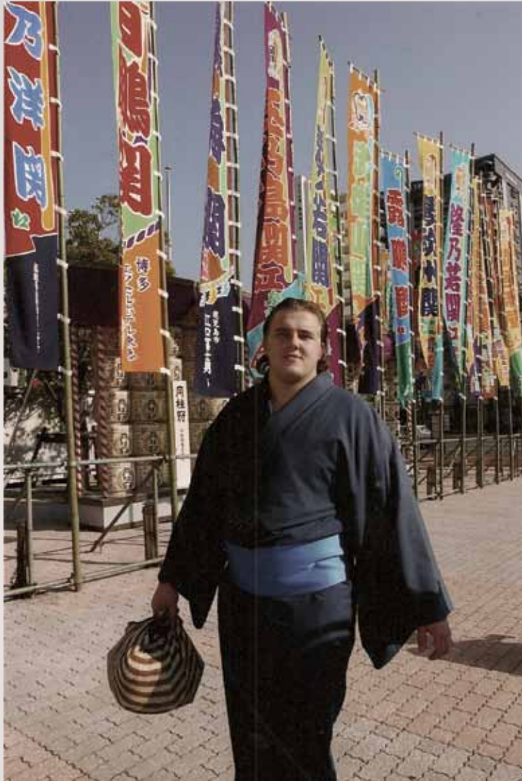
Going into the stable from the Fukuoka tournament.