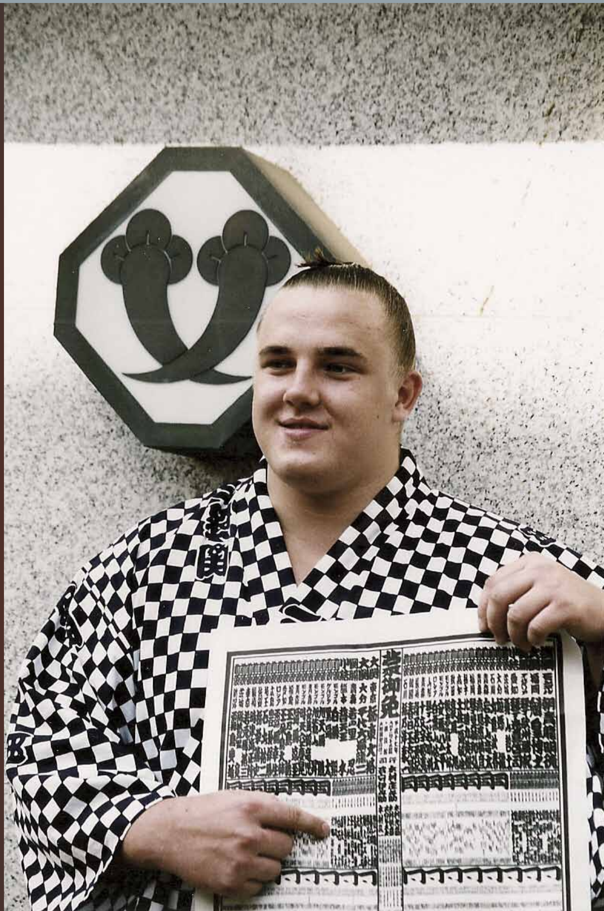
Baruto became a sekitori in the high league of Japanese sumo before the September tournament (Aki-basho) in 2005.