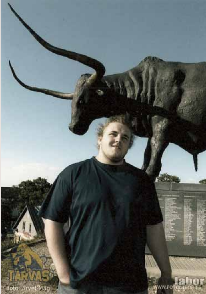
August 2008, in Rakvere.