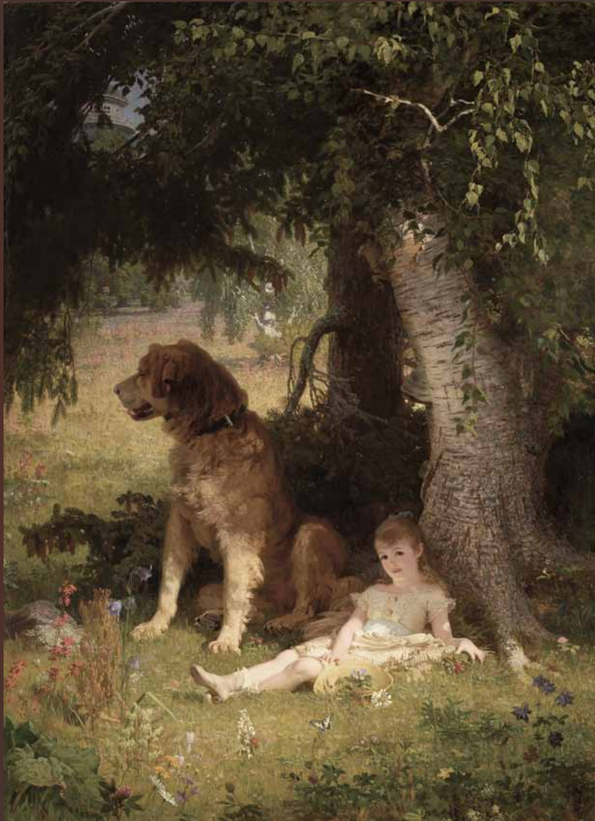
Photograph: Stanislav Stepashko

A favourite of the public out of all of the classics of Estonian art - Johann Köler.